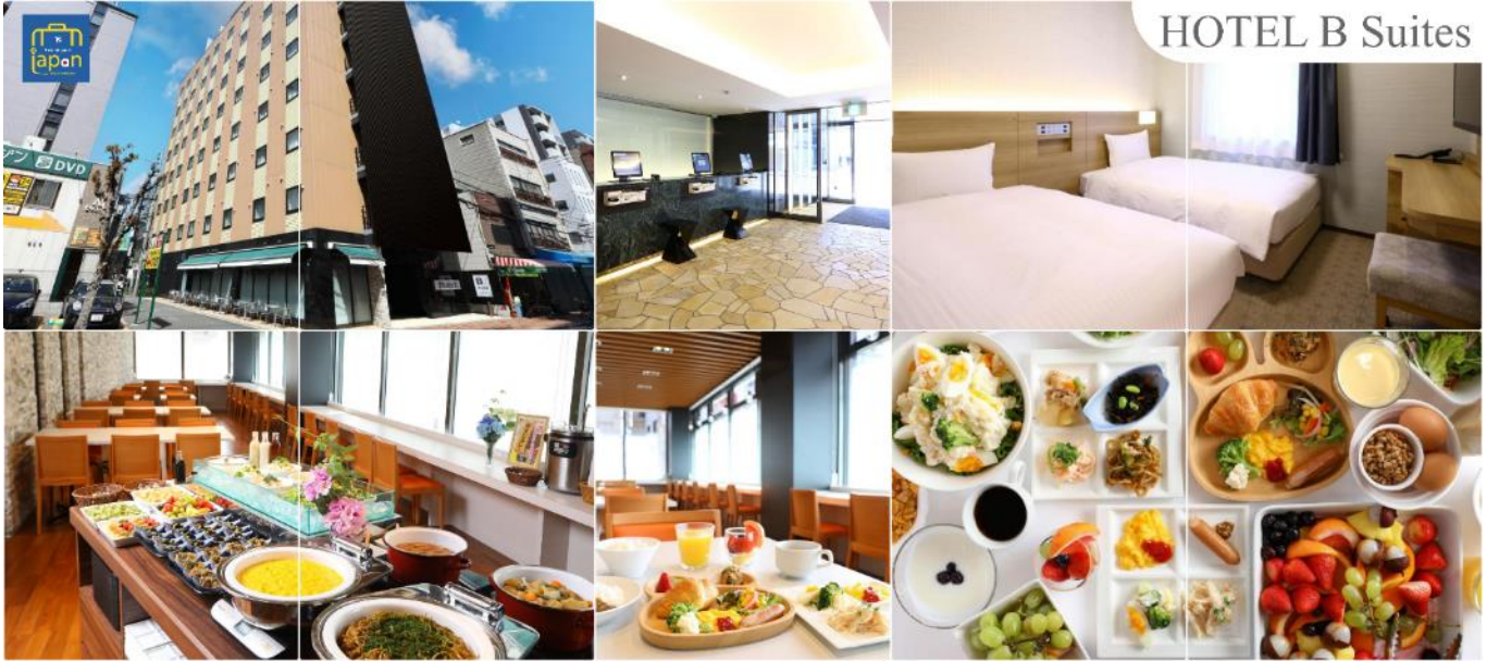
HOTEL B Suites

โทรศัพท์ : 042-246662 / 086-4515274 E-mail : journeyticket@hotmail.com