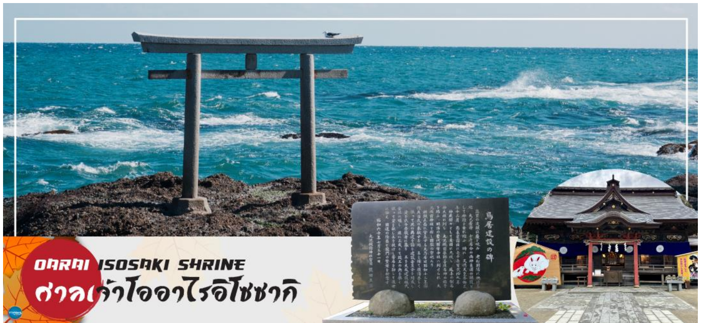
OARAI ISOSAKI SHRINE ศาลเจ้าโออาไรอิโซซากิ

วันที่สอง ท่าอากาศยานนานาชาตินาริตะ ประเทศญี่ปุ่น – เมืองอิบารากิ – ตลาดปลาโออาไร – ศาลเจ้าโออาไรอิโซซากิ – เมืองกุนมะ – คุซัตสึออนเซ็น – ยูมาทาเกะ – ออนเซ็น