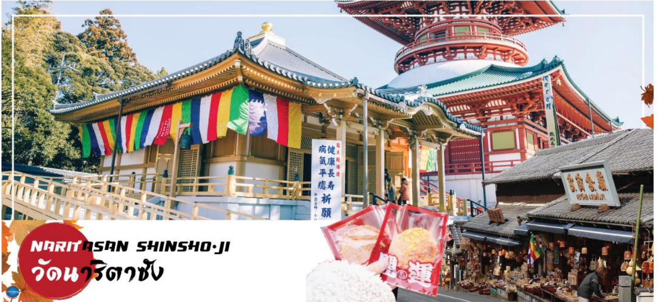
NARITASAN SHINSHO-JI วัดนาริตาซุ

โทรศัพท์ : 042-246662 / 086-4515274 E-mail : journeyticket@hotmail.com