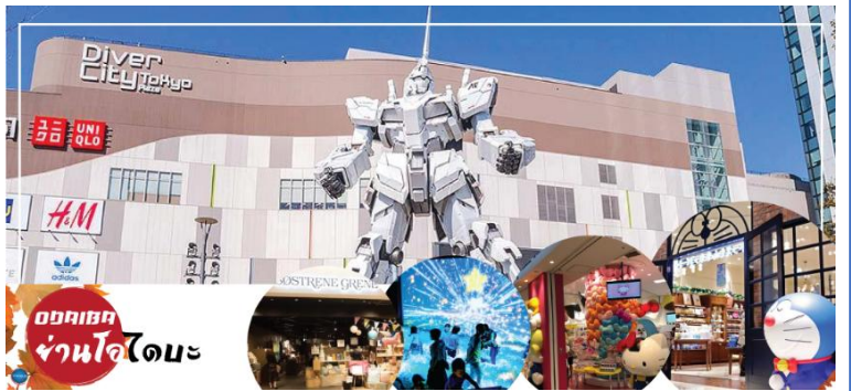
ออคเชด ย่านโอไดบะ

จากนั้นเดินทางสู่ ย่านโอไดบะ (Odaiba) เมืองคือเกาะที่สร้างขึ้นไว้เป็นแหล่งช้อปปิ้ง และแหล่งบันเทิงต่างๆ ในอ่าวโตเกียว ได้รับการปรับปรุงให้มีชื่อเสียงและเป็นที่ยอมรับในช่วงหลังของปี 1990 นอกจากนี้มีสถาปัตยกรรมที่สวยงามตั้งอยู่มากมายแล้ว แต่ก็ยังคงความเป็นธรรมชาติไว้ด้วยความอุดมสมบูรณ์ของพื้นที่สีเขียว ไดเวอร์ซิตี โตเกียว พลาซ่า (Diver City Tokyo Plaza) เป็นห้างดังอีกห้างหนึ่ง ที่อยู่บนเกาะ โอไดบะ จุดเด่นของห้างนี้ก็คือ หุ่นยนต์กันดั้ม ขนาดเท่าของจริง ซึ่งมีขนาดใหญ่มาก ในบริเวณห้าง อีสระช้อปปิ้งตามอัธยาศัย