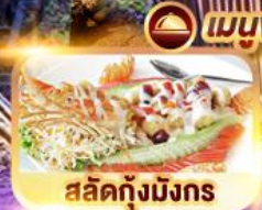
สลัดกุ้งมังกร