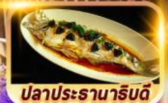
ปลาประธาราธิบดี