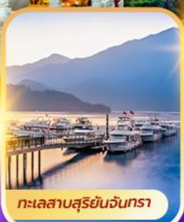
ทะเลสาบสุริยอันจันตรา