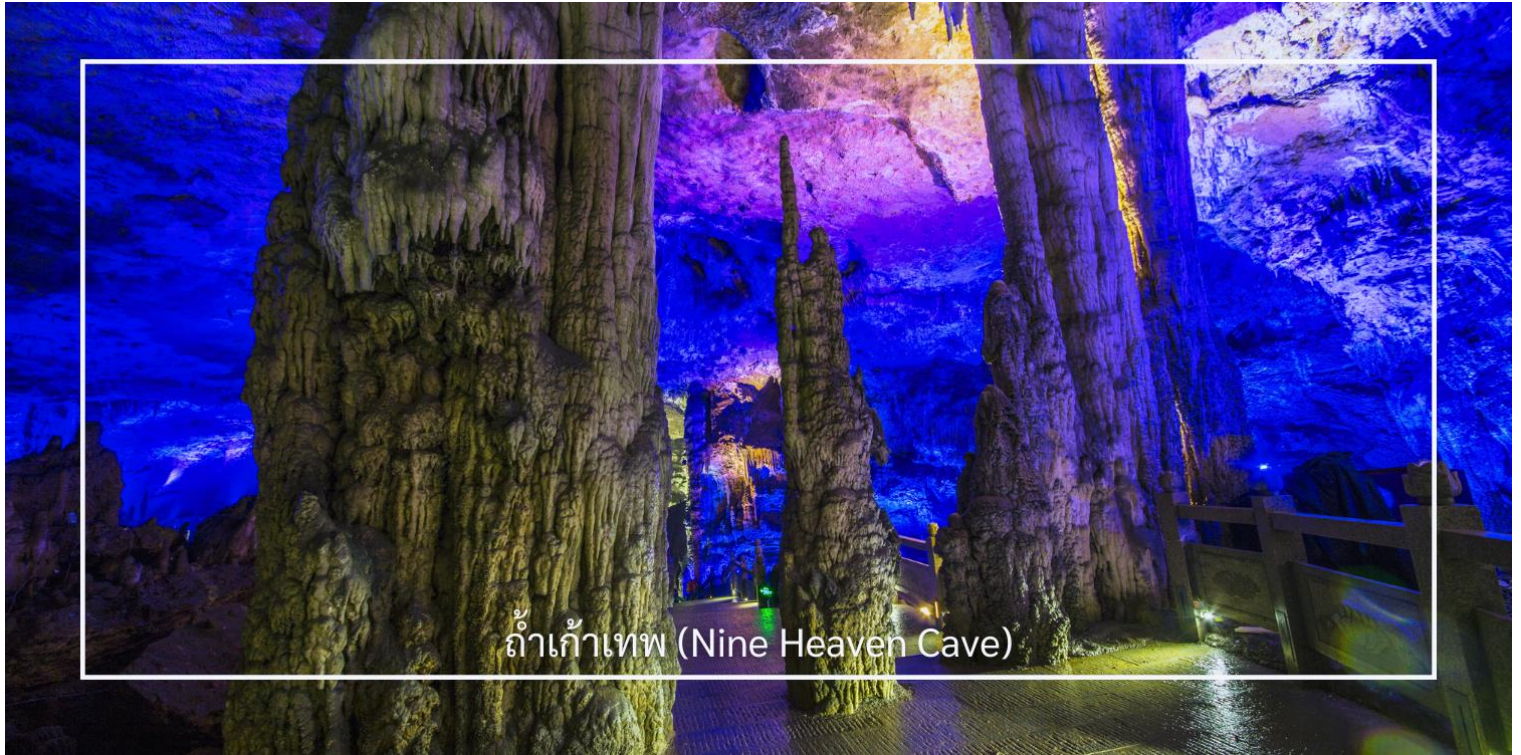
ถ้ำเก้าเทพ (Nine Heaven Cave)