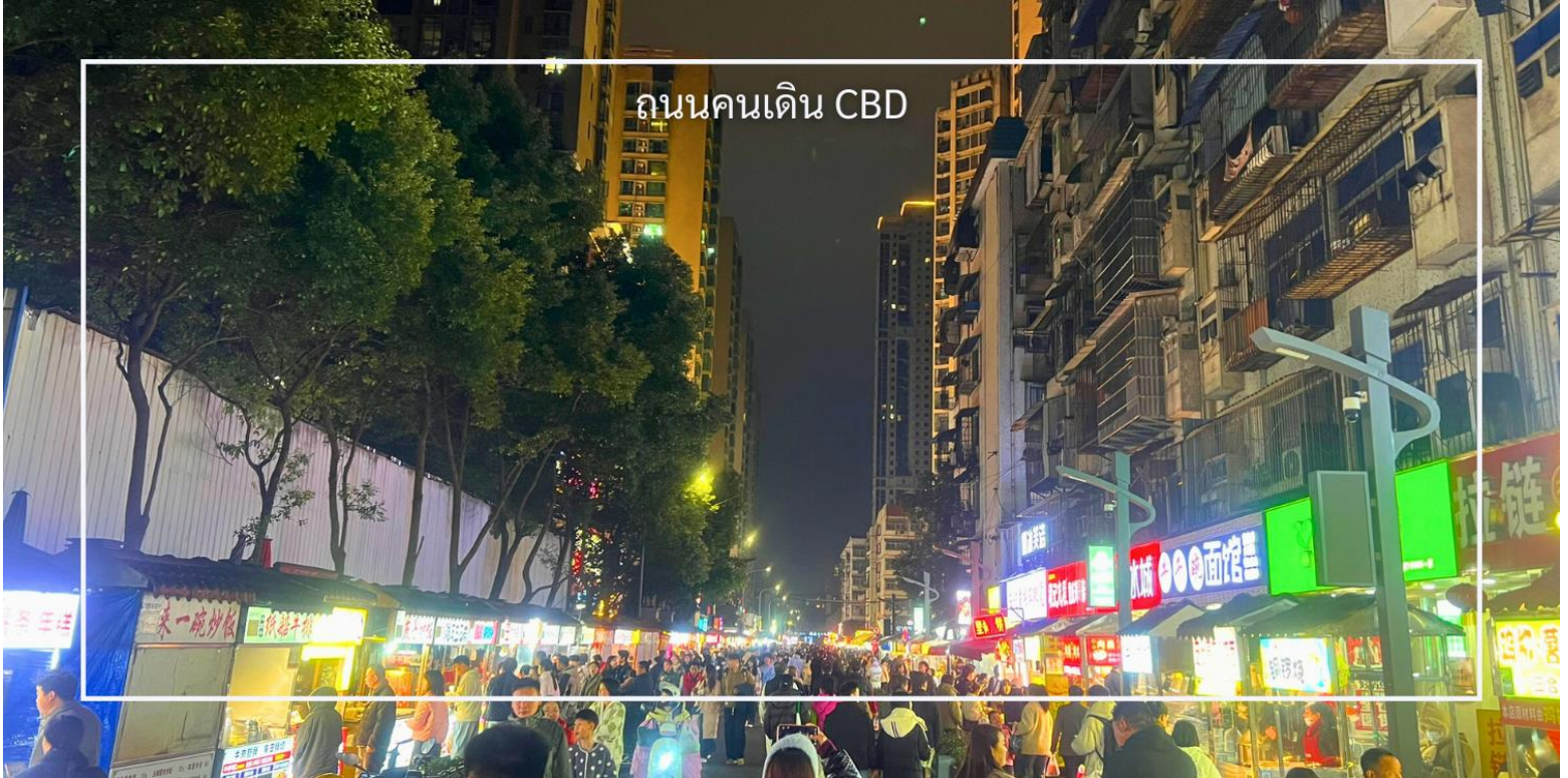
ถนนคนเดิน CBD