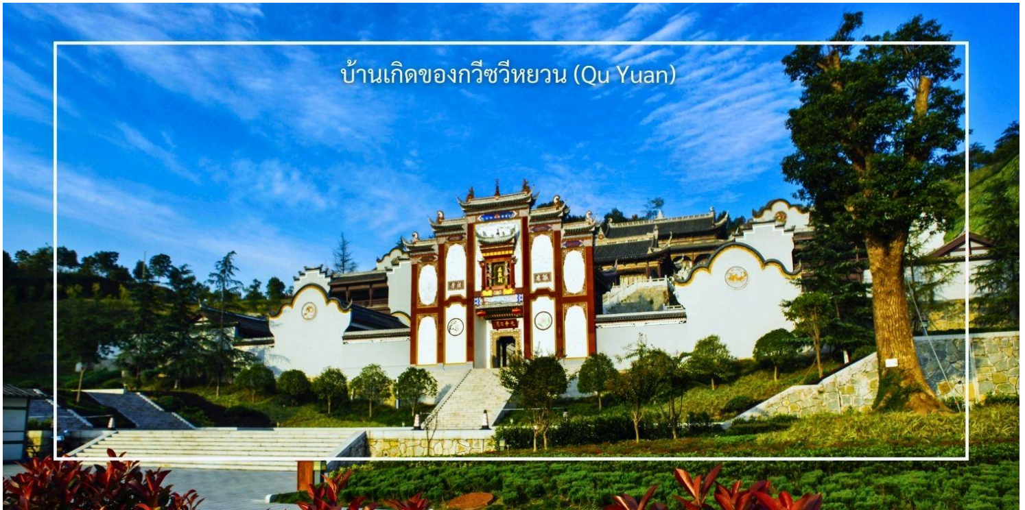
บ้านเกิดของกวีชวีหยวน (Qu Yuan)

ห้างสรรพสินค้ามากมาย เหมาะสำหรับเดินช้อปปิ้งและสัมผัสวิถีชีวิตคนเมือง