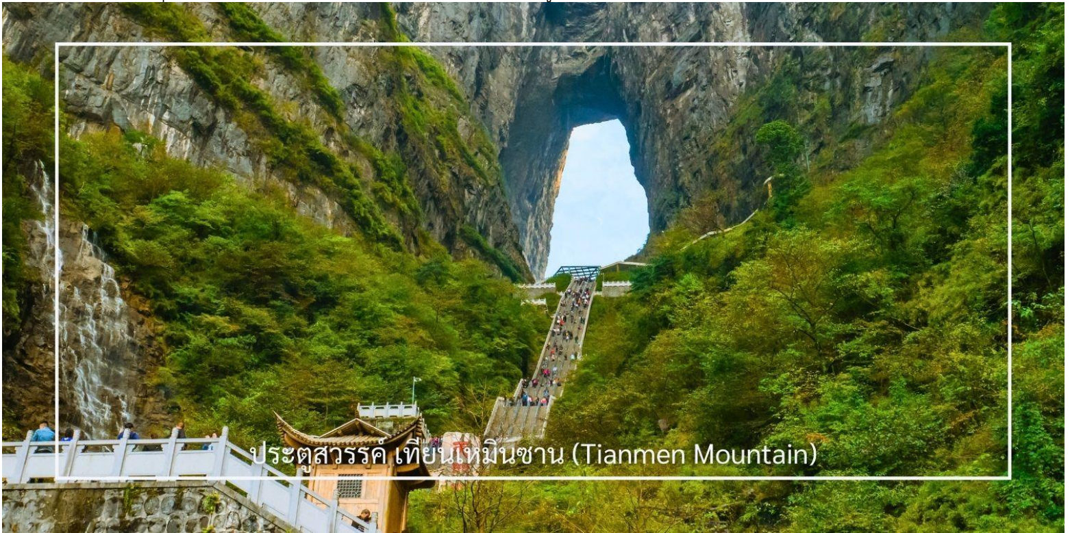
ประตูสวรรค์ เทียนเหมินซาน (Tianmen Mountain)

ประตูสวรรค์ โดย บันไดเลื่อนที่สร้างขึ้นโดยการเจาะทะลุภูเขาที่เรียงติดต่อกันถึง 5 ตอน เป็นเครื่องอำนวยความสะดวกใหม่ล่าสุดของ เขาเทียนเหมินซาน ท่านจะได้ถ่ายภาพ ประตูสวรรค์ อย่างใกล้ชิด