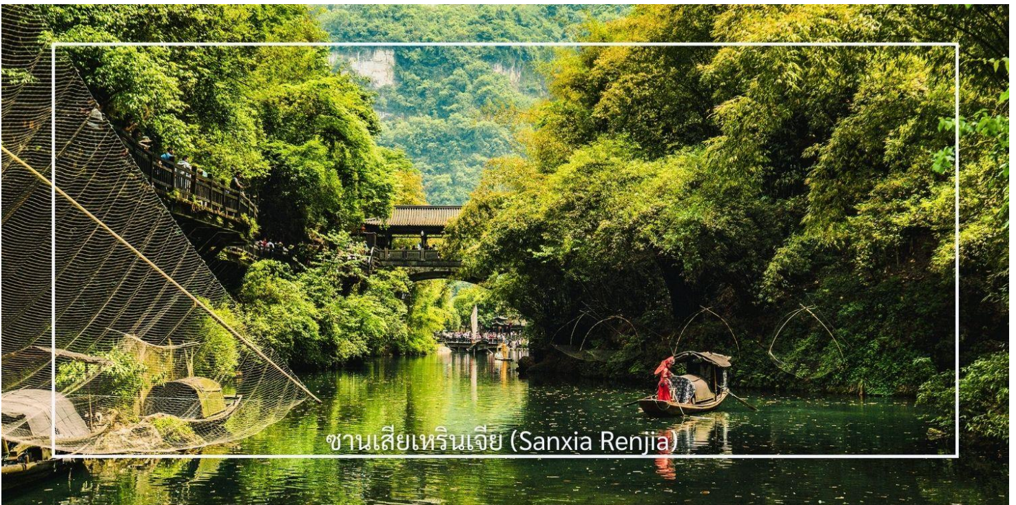
ซานเซียเหรินเจีย (Sanxia Renjia)

เช้า บริการอาหารเช้า ณ โรงแรมที่พัก (มื้อที่1)