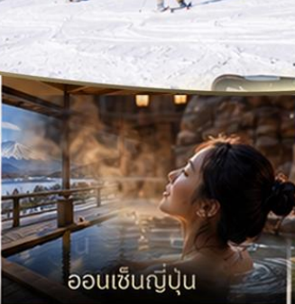
ออนเซ็นญี่ปุ่น