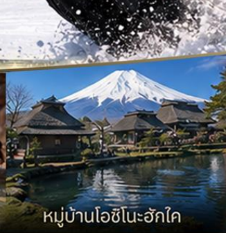
หมู่บ้านโอชิโนะอ๊กโค