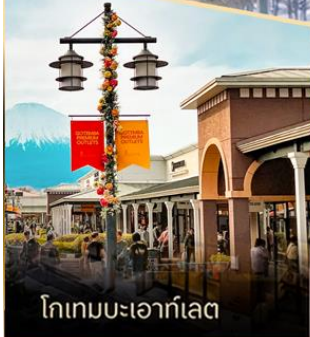
โทเทมมะเอาก์เล็ท