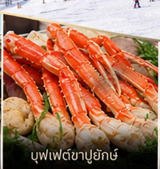
บุฟเฟต์ซาปูยักษ์