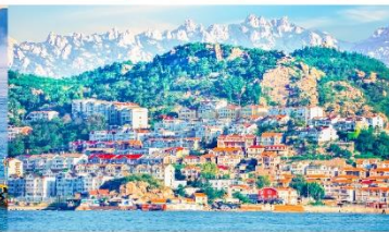
หมู่บ้านชาวประมงซาจื่อโซ่ว