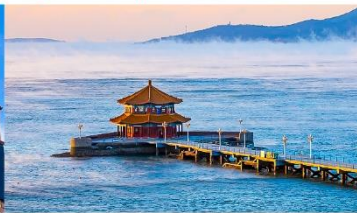
สะพานจันเฉียว