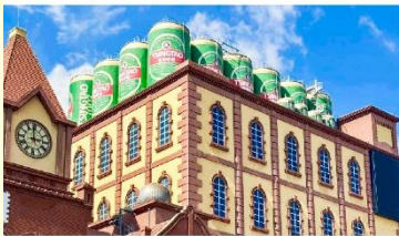
พิพิธภัณฑ์เบียร์ซิงเต่า