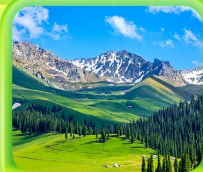
"กุ่มหญ้านาราภิบาล"