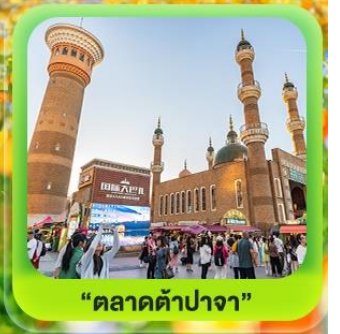
"ตลาดต้าปาจา"

ซินเจียงเหนือ ทะเลสาบไซลี่มู "น้ำตาหยดสุดท้ายของแอตแลนติก" • กุ่มหญ้านาราภิบาล กุ่มดอกไม้เทียนซาน • ผ่านชมสะพานกั๋วจื่อโกว • ถนนหลิวซิงเจียง • ตลาดต้าปาจา