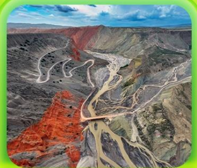
"แกรนด์แคนยอนตู้ซานจื่อ"

ซินเจียงเหนือ ทะเลสาบไซลี่มู "น้ำตาหยดสุดท้ายของแอตแลนติก" • กุ่มหญ้านาราภิบาล กุ่มดอกไม้เทียนซาน • ผ่านชมสะพานกั๋วจื่อโกว • ถนนหลิวซิงเจียง • ตลาดต้าปาจา