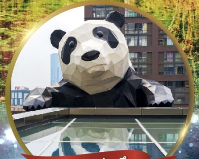
แพนด้ายักษ์ปีนตึก

มหัศจรรย์ความงาม อุทยานจิวจ้ายโกว (รวมรถเหมาเที่ยวอุทยานเต็มวัน) ชมอุทยานหวงหลง (รวมกระเช้า) • สีดรุณี • อุทยานจงเจียวโกว (รวมรถอุทยาน) เมืองเก่าชางพาน • ถนนคนเดินจินหลี่ + ไถ่กูหลี่ • ชมแพนด้ายักษ์ปีนตึก