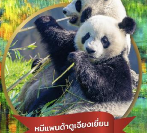
หมีแพนด้ายักษ์ปิ่นตึก