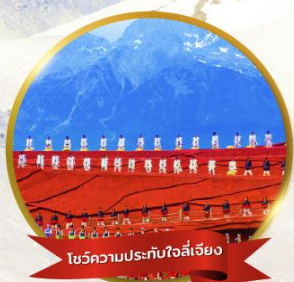
โชว์ความประทับใจลี่เจียง