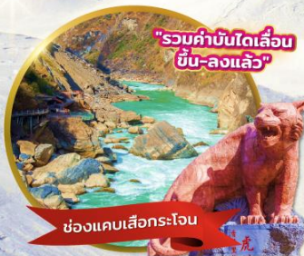
"รวมค่าบัตรเดิน ขึ้น-ลงแล้ว"