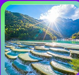
“ทะเลสาบโป๋ซู่เหอ”