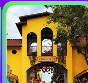
“หน้าหยวนมิเตอร์ถง”