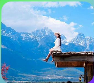
“กาแฟ Yun Di An Coffee”