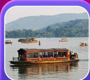
“ล่องเรือทะเลสาบซีหู”