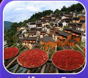
“หมู่บ้านหลงหลิง”

หุบเขาเทวดาวังเซียนกู่ หมู่บ้านที่ตั้งอยู่ริมหน้าผา • หมู่บ้านโบราณหลงหลิง ป่าสนน้ำชิงซาน • ล่องเรือทะเลสาบซีหู • ถนนโบราณตู้เจ้อ • ชมแสงสีที่ อุโมงค์โจว