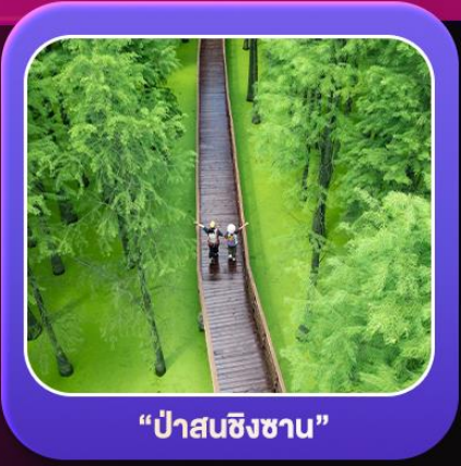
“ป่าสนชิงซาน”