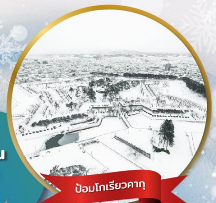
ป้อมโทริเยวคาคุ

หมู่บ้านนิงเกิลเกอเรส • สวนสัตว์อาซาฮิยาม่า • ชมขบวนพาเหรดเพนกวิน ตลาดเช้าฮาโกดาเตะ • ป้อมโทริเยวคาคุ • นั่งกระเช้าชมเมืองฮาโกดาเตะ ลานสกี • HILL OF BUDDHA • ไอตารุ • คลองไอตารุ • หมู่บ้านราเมน