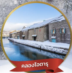
คลองไอตารุ