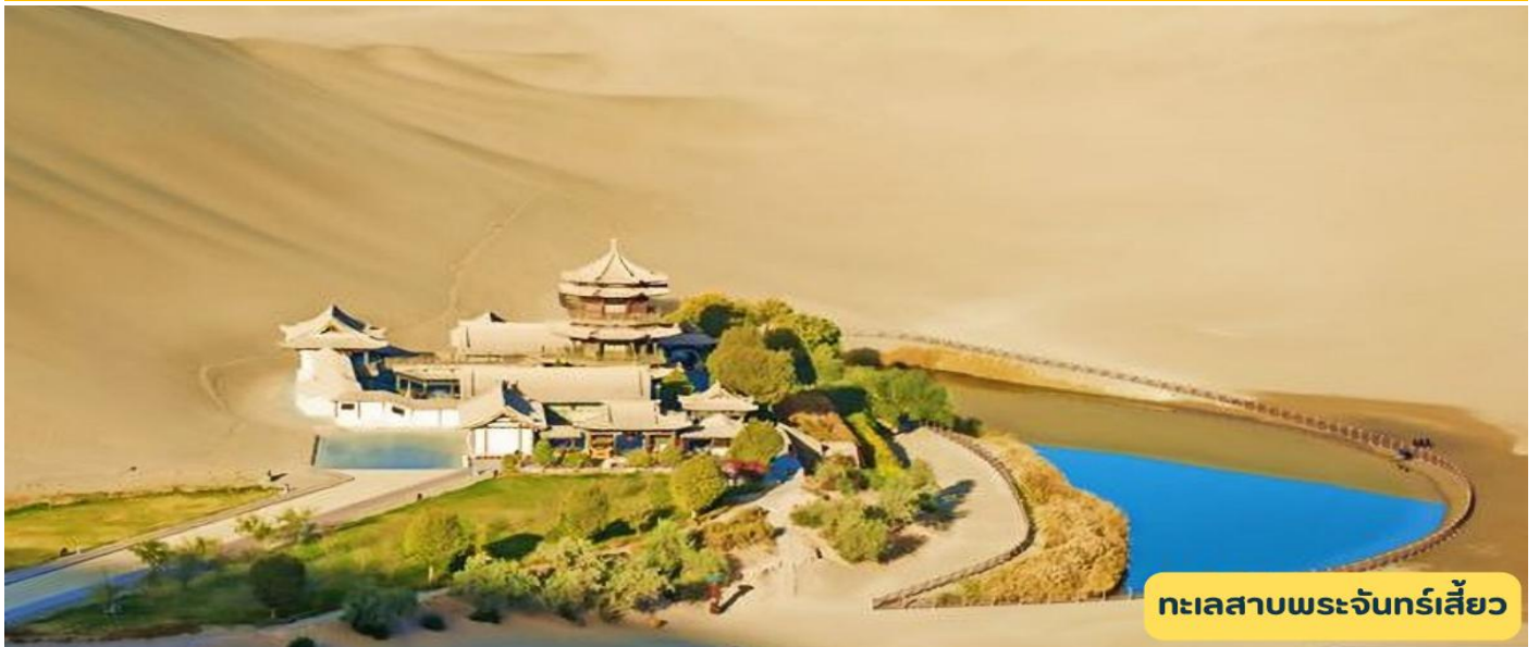
ทะเลสาบพระจันทร์เสี้ยว

เช้า 🕒 รับประทานอาหารเช้า ณ ห้องอาหารโรงแรม