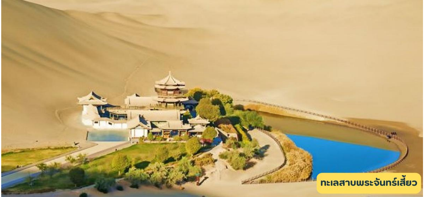
ทะเลสาบพระจันทร์เสี้ยว

วันที่สี่ เมืองเจียอี้กวน - จัตุรัสป้อมปราการ – คุณหวง - หมิงซาซาน – ทะเลสาบพระจันทร์เสี้ยว