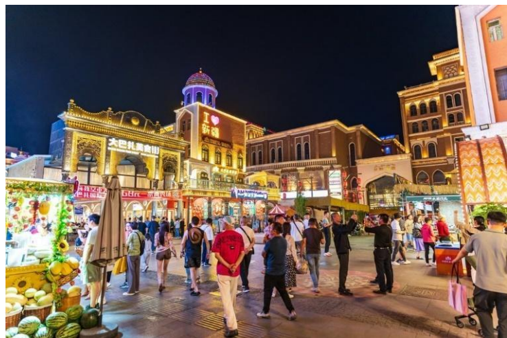
นำท่านเพลิดเพลินกับการช้อปปิ้งที่ ตลาดนานาชาติต้าปายา (Grand Bazaar)

เดินทางถึง เมืองอุรุมชี (Urumqi) อุรุมชีเป็นเมืองหลวงของเขตปกครองตนเองซินเจียงอุยกูร์ และเป็นมหานครที่ใหญ่ที่สุดในภาคตะวันตกเฉียงเหนือของจีน ในอดีตเมืองแห่งนี้เคยเป็นจุดแวะพักที่สำคัญยิ่งบนเส้นทางสายไหม ปัจจุบันอุรุมชีได้เติบโตและพัฒนาเป็นเมืองที่ผสมผสานความเจริญรุ่งเรืองของตีกระฟ้าสมัยใหม่ เข้ากับเสน่ห์ของวัฒนธรรมท้องถิ่นและชนเผ่าพื้นเมือง (โดยเฉพาะชาวอุยกูร์) ได้อย่างลงตัวและมีเอกลักษณ์เฉพาะตัว