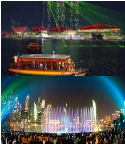
ลานที่นั่งหันหน้าออกทางอ่าว Marina

จากนั้นนำท่าน เปิดประสบการณ์กับการเดินทางแสนพิเศษ นั่งเรือแบบคลาสสิกโบราณที่เป็นเอกลักษณ์ของประเทศสิงคโปร์ หรือที่เรียกว่า Bumboat ล่องเรือชมสถานที่ไฮไลท์ของสิงคโปร์ และเก็บภาพสวยๆจากมุมมองแม่น้ำ เช่น เมอร์ไลออน, สะพานเกลียว Helix Bridge, อาคารรูปเรือ มารินาเบย์ แซนด์ เป็นต้น จะใช้เวลารอบละประมาณ 40 นาทีด้วยกัน (รวมค่าบริการ Bumboat)