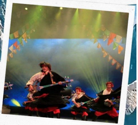
โชว์ทิเบต