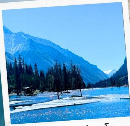
อุทยานชวงเฉียวโกว