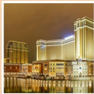
เดอะเวเนเชียน

จุดชมฟูจิจากสวนสนุกที่ไม่เหมือนใคร บนฟูจิยามะ สกายเด็ค โตเกียวดิสนีย์แลนด์ สวนสนุกในฝันของทุกคนในครอบครัว สักการะ อุชิคุโดบุทลี องค์พระใหญ่ที่สุดของประเทศญี่ปุ่น เปลี่ยนบรรยากาศนั่งรถไฟริมทะเลสุดคลาสสิก ในเมืองคามาคุระ กราบไหว้ขอพรกับเทพเจ้าองค์ไท่ส่วยเจี๋ย วัดเปาถง สัมผัสความอลังการของ เดอะเวเนเชียน รีสอร์ทระดับเวิลด์คลาส พักออนเซ็น 1 คืน!!! // อาหาร : บุฟเฟต์ชาบูยักษ์, บุฟเฟต์ชาบู กรุ๊ปสบายๆ เพียง 20-25 ท่านเท่านั้น!!!