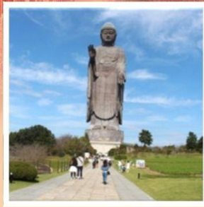
พระพุทธรูปอุชิคุโดบุทลี