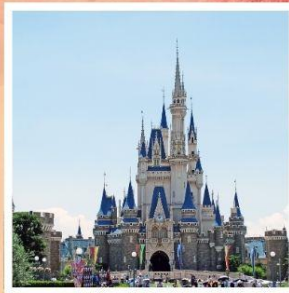
โตเกียว ดิสนีย์แลนด์