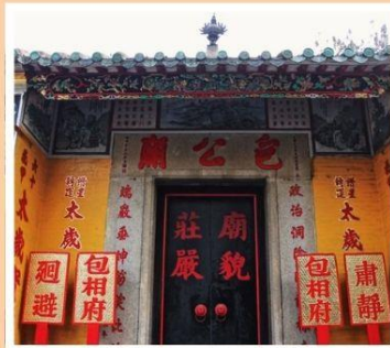
วัดเปาถง