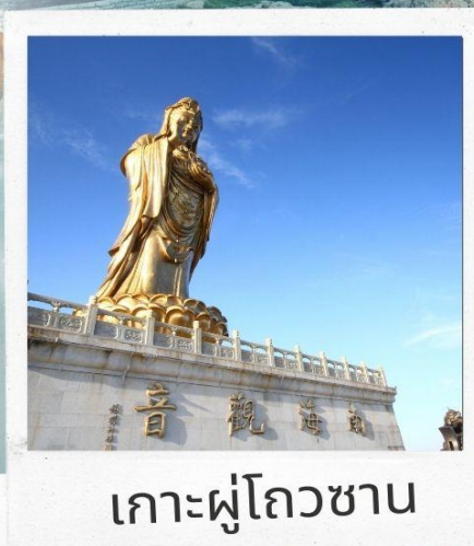
เกาะผู้โถวซาน