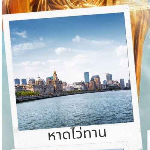
หาดไ่ว่ทาน