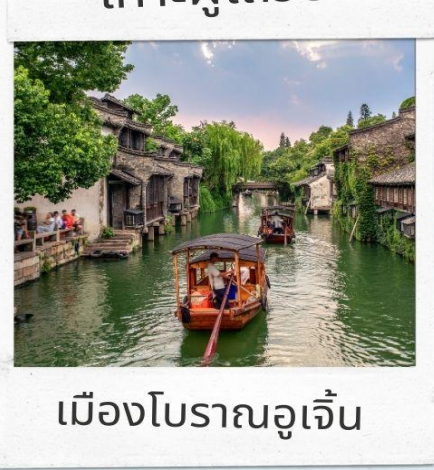
เมืองโบราณอูเจิ้น