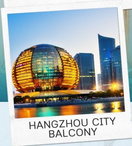
HANGZHOU CITY BALCONY