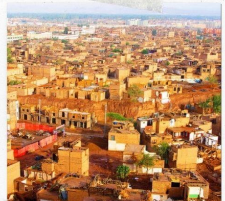
เมืองคาสือ