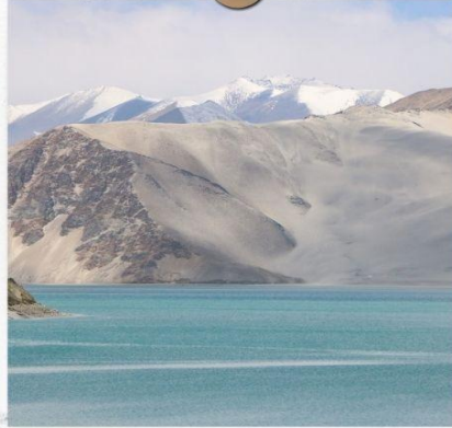
ทะเลสาบไป่ซาหู