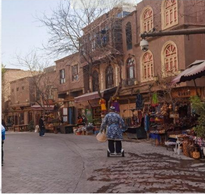
เมืองโบราณคัชการ์

โทรศัพท์ : 042-246662 / 086-4515274 E-mail : journeyticket@hotmail.com