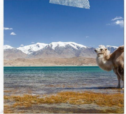
ทะเลสาบคาลาคู่เล่อ