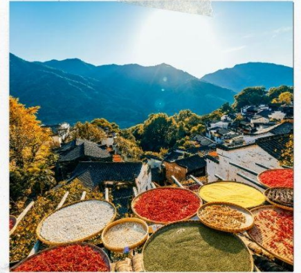
หมู่บ้านหงส์