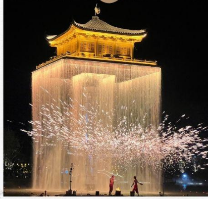
แสงไฟอุโมงค์