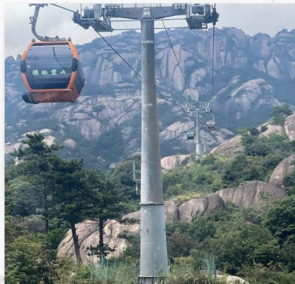
เขาลิงซาน