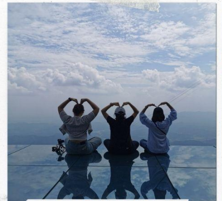
กระจกแห่งท้องฟ้า