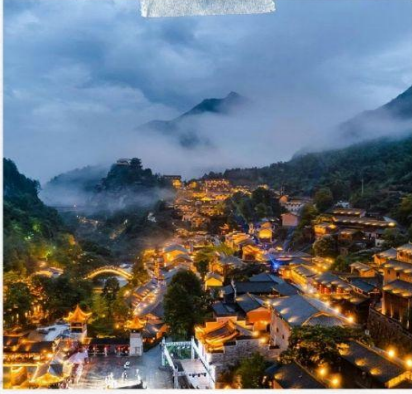
หุบเขาวังเซียนกู่

โทรศัพท์ : 042-246662 / 086-4515274 E-mail : journeyticket@hotmail.com