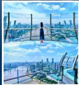
RAFFLES CITY CHONGQING