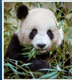
ศูนย์อนุรักษ์หมี แพนด้า