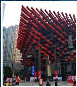
พิพิธภัณฑ์ศิลปะ ฉงชิ่ง