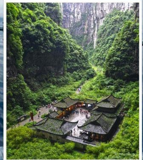
อุทยานหลุมฟ้า สะพานสวรรค์