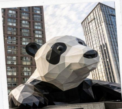
ถนนชุนซีลู่