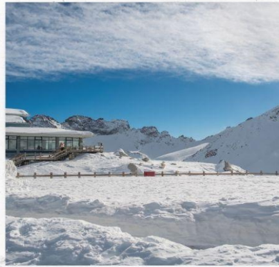
ภูเขาหิมะการ์เซียต้ากู่ปิงชว่น