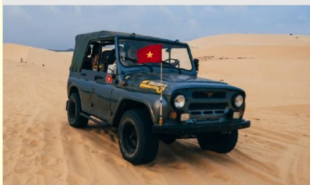
ทะเลทรายขาว