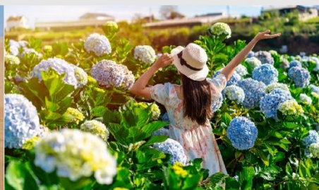
สวนดอกไฮเดรนเยีย