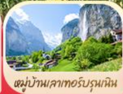
หมู่บ้านเลาเทอร์บรุนเนน