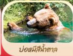
บ่อเหมืสิน้ำตาล