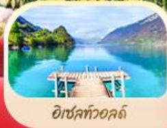
อิชเลทวอลด์