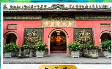
วัดต้าฉือ