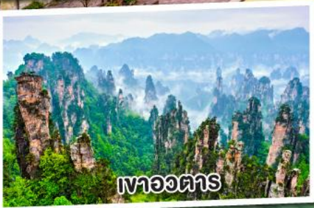
เหวอวตาร