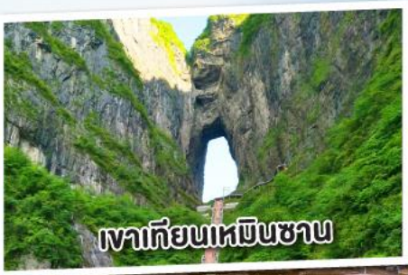
เขาเกียนเหมินซาน

ฉางเจียเจีย เกียนเหมินซาน เหวอวตาร สะพานแก้ว เมืองโบราณฝูหรง เฟิ่งหวง 5 วัน 4 คืน