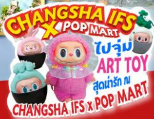
เวาอวตาร