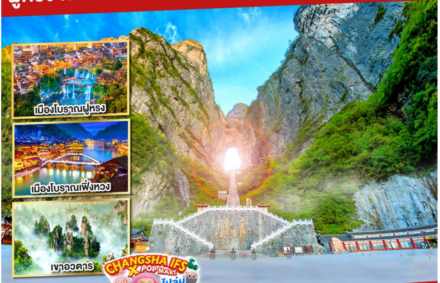
เมืองโบราณฟูหลง