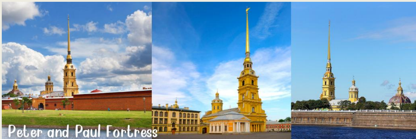
Peter and Paul Fortress

เมืองและห้อมสร้างสิ่งก่อสร้างที่สูงกว่า ภายในทำการตกแต่งด้วยศิลปะบารอกซึ่งนับว่าแตกต่าง กับโบสถ์คริสต์ออร์ทอดอกซ์ทั่วไปและวิหารแห่งนี้ยังเป็นที่เก็บศพของราชวงศ์โรมานอฟ เริ่มต้นจากพระเจ้าปีเตอร์มหาราชเป็นองค์แรก จนกระทั่งถึงกษัตริย์องค์สุดท้ายของราชวงศ์