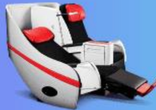
พรีเมียมเฟลตเบด