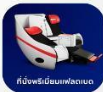
ที่นั่งพรีเมียมเฟลคเบต