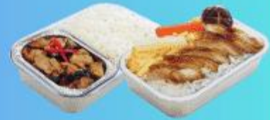
บริการอาหารร้อนบนเครื่องบิน ชาไป - ชากลับ