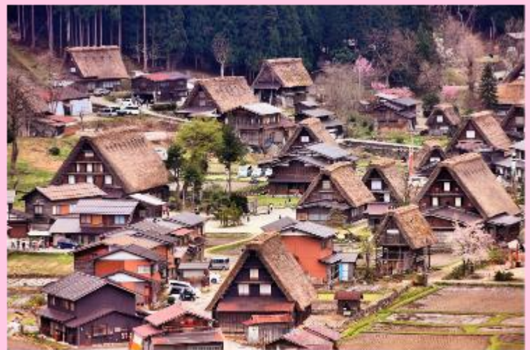
รูปใช้เพื่อประกอบการโฆษณาเท่านั้น