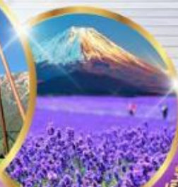
โออิชิ ปาร์ค

29,919 บาท ราคาเริ่มต้น รวมภาษีมูลค่าเพิ่ม 7%