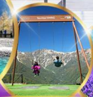
ชิงช้า Yoo hoo! Swing