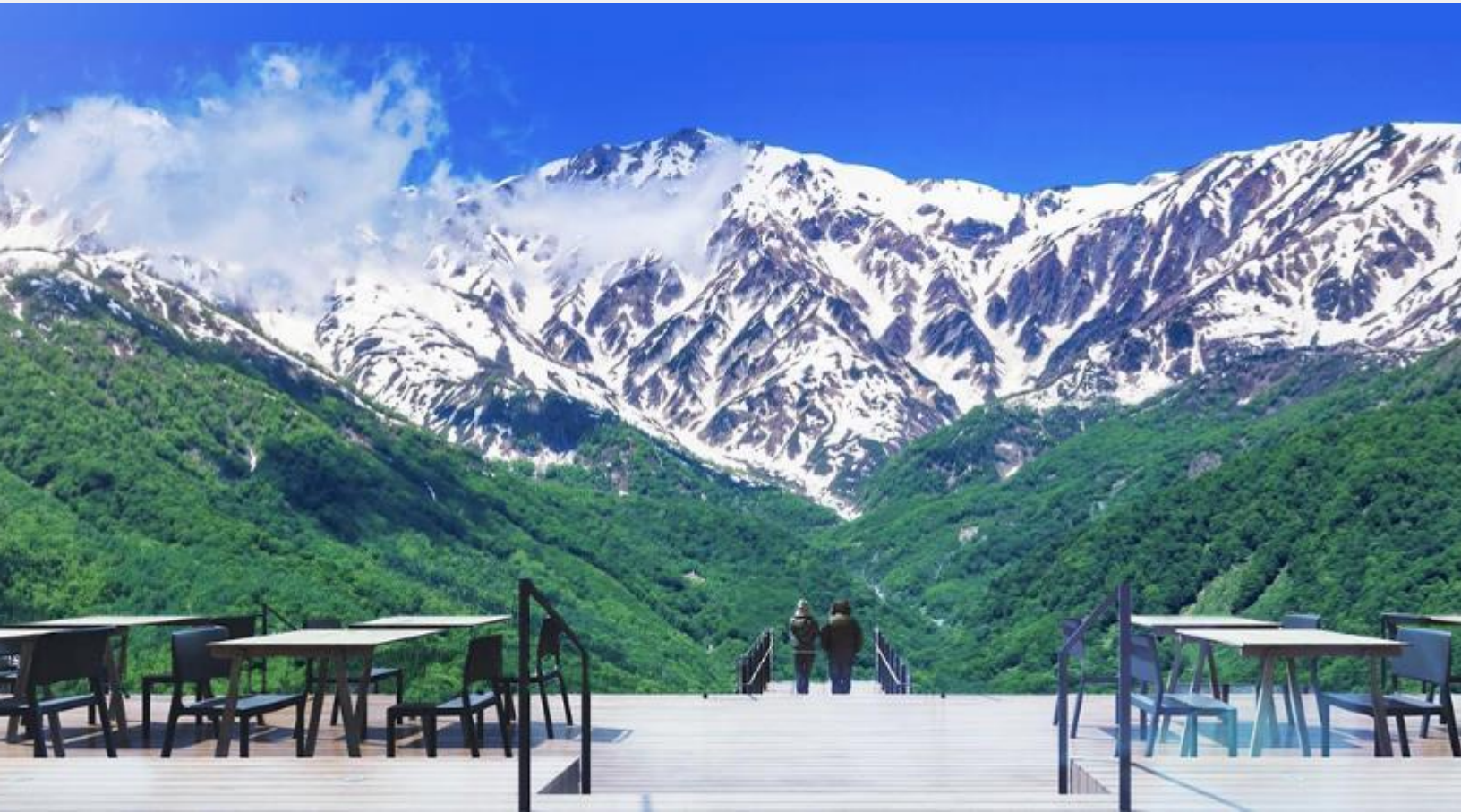
HAKUBA MOUNTAIN HARBOR

โทรศัพท์ : 042-246662 / 086-4515274 E-mail : journeyticket@hotmail.com