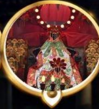
วัดเจ้าแม่กวนอิมฮ่องกง วอพรสุภภาพ