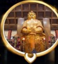
วัดแชกง วอพรโซคลาก