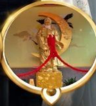
วัดหวังต้าเซียน วอพรความรัก