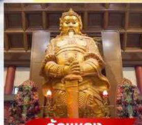
วัตต์แชงก