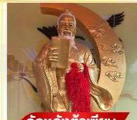
วัตต์หวังต้าเซี่ยน