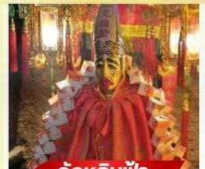
วัตต์หลินฟ้า