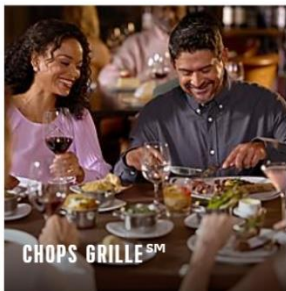
CHOPS GRILLE SM

Whether you're craving breakfast, lunch, dinner or an afternoon snack, get it delivered with Room Service, available 24/7.