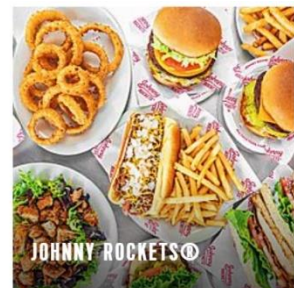
JOHNNY ROCKETS ®