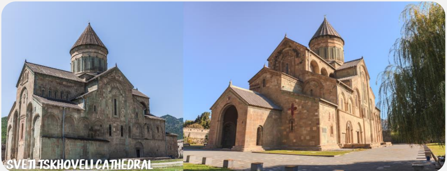
SVETI TSKHOVELI CATHEDRAL

นำท่านไปชม วิหารสเวตีสโคเวลี (SVETI TSKHOVELI CATHEDRAL) ซึ่งเป็นโบสถ์อีกแห่งหนึ่งที่อยู่ในบริเวณของมิตสเคต้า ที่มีรูปแบบของจอร์เจียออร์ทอดอกซ์สร้างขึ้นในราวศตวรรษที่ 11 โบสถ์แห่งนี้ถือเป็นศูนย์กลางทางศาสนาที่ศักดิ์สิทธิ์ที่สุดของจอร์เจีย สร้างขึ้นโดยสถาปนิกชาวจอร์เจียชื่อ ARSUKISDZE มีขนาดใหญ่เป็นอันดับสองของประเทศอีกทั้งยังเป็นศูนย์กลางที่ทำให้ชาวจอร์เจียเปลี่ยนความเชื่อและหันมานับถือศาสนาคริสต์ และให้ศาสนาคริสต์มาเป็นศาสนาประจำชาติของจอร์เจียเมื่อปี ค.ศ.337 และถือเป็นสิ่งก่อสร้างยุคโบราณที่มีขนาดใหญ่ที่สุดของประเทศจอร์เจีย