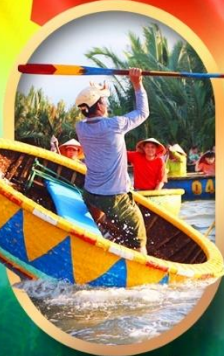
ล่องเรือกระดังง์