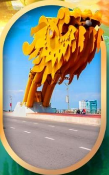
สะพานมังกรคานัง