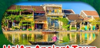
HoiAn Ancient Town ย่านเมืองเก่าฮอยอัน