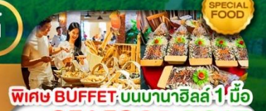
พิเศษ BUFFET: บนนานาฮิลล์ 1.1 มื้อ และ SEAFOOD BOAT เดินทาง มี.ค. - ต.ค. 69