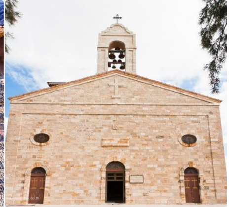
ทะเลเดดซี, เขาไซนาย, อียิปต์ ฯลฯ

นำท่านเดินทางสู่ ยอดเขาเมทเนโบ MOUNT NEBO มีความสูง 817 เมตร จากระดับน้ำทะเล เชื่อกันว่าเป็นสถานที่ฝังศพของโมเสส ผู้นำชาวยิวส์ที่เดินทางจากอียิปต์มายังเยรูซาเลม และเป็นสถานที่ศักดิ์สิทธิ์ที่สุดแห่งหนึ่งของจอร์แดน ที่แห่งนี้เป็นที่สุดท้ายของโมเสส ก่อนจะขึ้นทางให้ผู้สืบทอดนำพาผู้คนไปยังดินแดนพันธสัญญา ในประเทศอิสราเอลปัจจุบัน เมื่อยืนอยู่บนยอดเขาจะมองไปเห็นดินแดนแห่งพันธสัญญา THE PROMISED LAND ที่โมเสสเคยเห็นบนยอดเขา และเป็นที่จารึกแสวงบุญของชาวคริสต์มาแต่โบราณ และโบสถ์บนยอดเขาได้ถูกสร้างขึ้นในปลายศตวรรษที่สี่เพื่อเป็นการบ่งชี้จุดที่คาดว่าโมเสสเสียชีวิต MOUNT NEBO ยังเคยเป็นสถานที่มาเยือนของสันตะปาปา ของศาสนาคริสต์ โดยสันตะปาปาจอห์นปอลที่ 2 ได้มาแวะพำนักที่นี่ ระหว่างการเดินทางไปเยือนดินแดนศักดิ์สิทธิ์ และได้ปลุกต้นมะกอก สัญลักษณ์ของสันติภาพไว้ข้างๆโบสถ์ไบแซนไทน์ด้วย