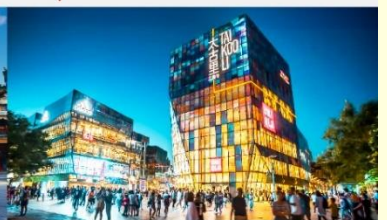
ย่านซุนหลี่ถุน

*ทางบริษัทฯ ขอสงวนสิทธิ์ในการสลับโปรแกรมทัวร์ตามความเหมาะสมขึ้นอยู่กับสถานการณ์หน้างาน โดยคำนึงถึงผลประโยชน์ของลูกค้าเป็นสำคัญ