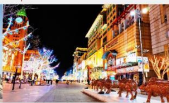
ถนนหวังฝูจิ่ง

*ทางบริษัทฯ ขอสงวนสิทธิ์ในการสลับโปรแกรมทัวร์ตามความเหมาะสมขึ้นอยู่กับสถานการณ์หน้างาน โดยคำนึงถึงผลประโยชน์ของลูกค้าเป็นสำคัญ