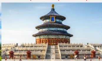
หอสักการะฟ้าเทียนถาน