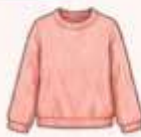
เสื้อสเวตเตอร์ถัก หรือคาร์ดิแกน