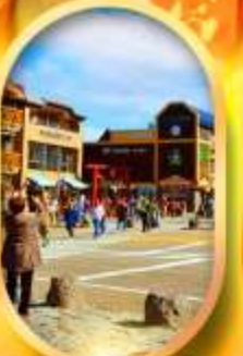
ภูเขาไฟฟูจิ ชั้น 5