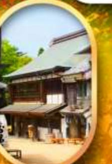
พิพิธภัณฑ์กลางเจียงโบโซ