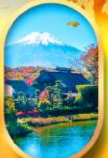
โอชิโนะฮักโก