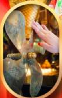
หมูนกกังหันแซง