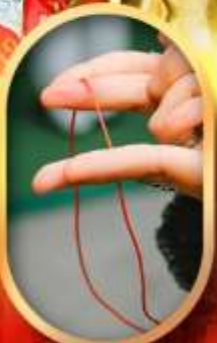
เสริมดวงความรัก