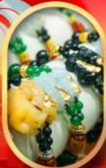
ร้านหยกอัญมณี