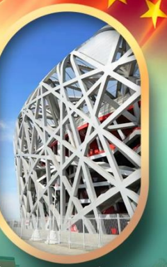
ผ่านชมสนามกีฬารังนก