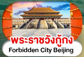
พระราชวังต้องห้าม Forbidden City Beijing