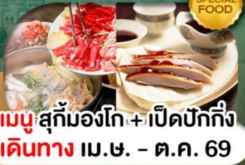
เมนูสุกั่มองโก + เปิดปักกิ่ง เดินทาง เม.ษ. - ต.ค. 69