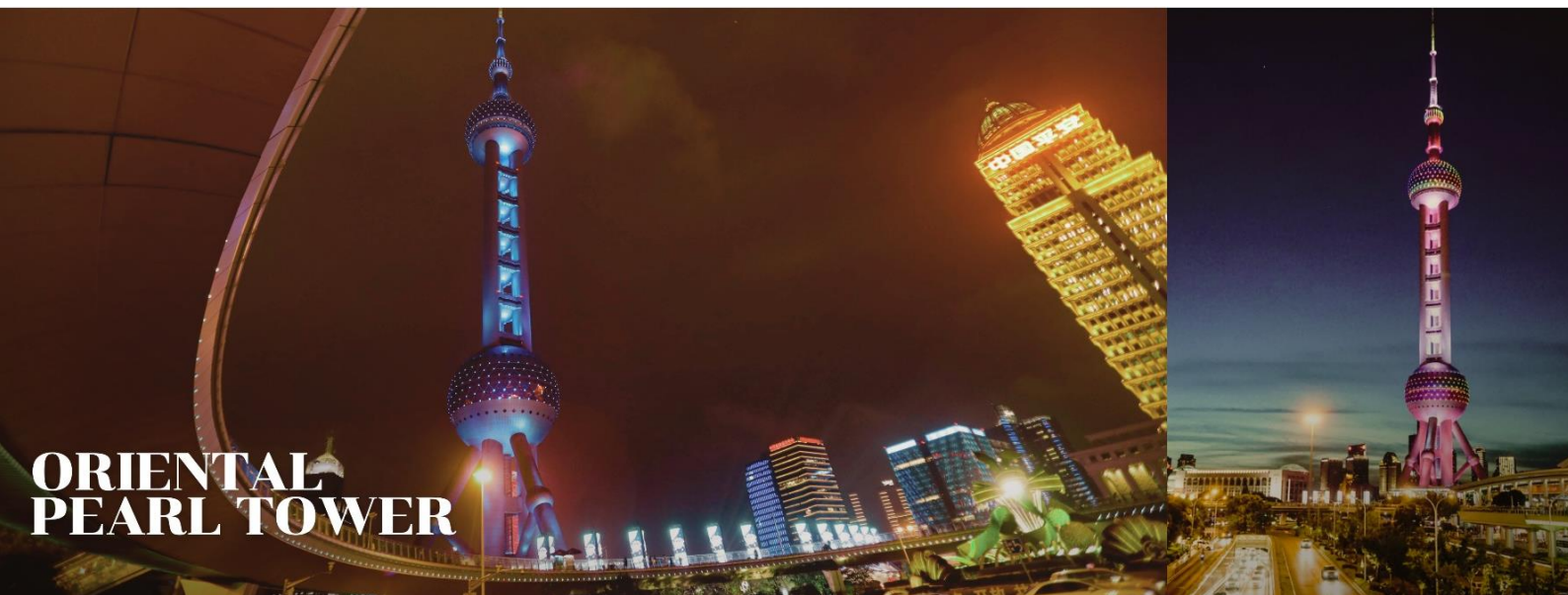
ORIENTAL PEARL TOWER

นำท่าน ผ่านชม หอไข่มุก หนึ่งในแลนด์มาร์คสำคัญของนครเซี่ยงไฮ้และประเทศจีน หอไข่มุกหรือหอส่งสัญญาณวิทยุ โทรทัศน์ที่สูงที่สุดในโลก โดยมีระดับความสูงที่ 468 เมตร ตั้งตระหง่านอยู่ในย่านผู้ตง ริมน้ำหวงผู่ โดยรูปลักษณะของ หอไข่มุก โดดเด่นแปลกตาตรงที่มีไข่มุกสีแดงไล่ขนาดที่วางเรียงตัวขึ้นสู่ตัวตึก การผสมผสานสถาปัตยกรรมอันทันสมัย แห่งโลกอนาคตกับศิลปกรรมจีนโบราณเอาไว้อย่างลงตัว