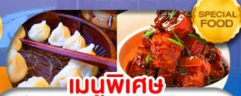
เมนูพิเศษ เสี่ยวหลงเปา หมูน้ำแดง เติมน้ำตาล ต.ค. 69 - มี.ค. 70