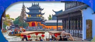
Zhujiajiao Ancient Town ล่องเรือเมืองโบราณ

เชียงใหม่ ดิสนีย์แลนด์ เมืองโบราณจูเจียเจียว