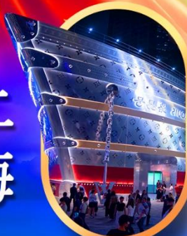
เรือคระหลุยส์