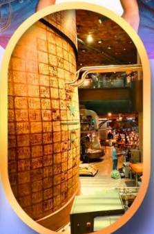
ร้านสตาร์บักส์