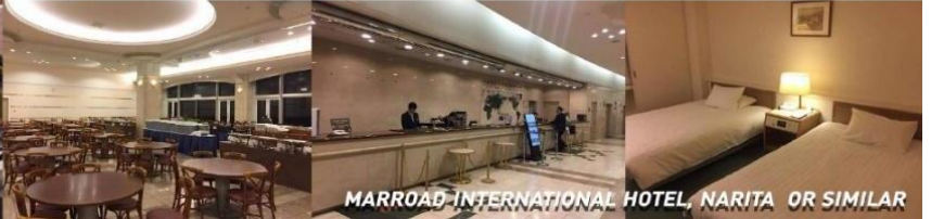
MARROAD INTERNATIONAL HOTEL, NARITA OR SIMILAR

ค่า อิสระอาหาร ตามอัธยาศัยเพื่อสะดวกแก่การช้อปปิ้ง ที่พัก MARROAD INTERNATIONAL HOTEL, NARITA หรือเทียบเท่า