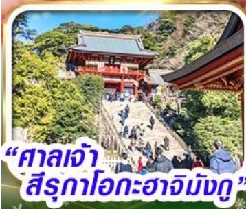
“ศาลเจ้า สิริรุกะฮะฮาจิมันงุ”