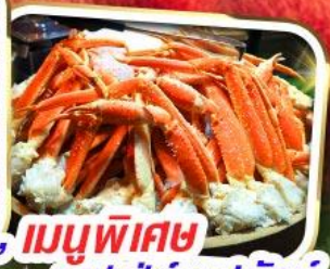
เมนูพิเศษ บุฟเฟ่ต์ซาบูยักิชิ

ราคาเริ่มต้น 29,999 *รวมภาษีมูลค่าเพิ่มแล้ว*