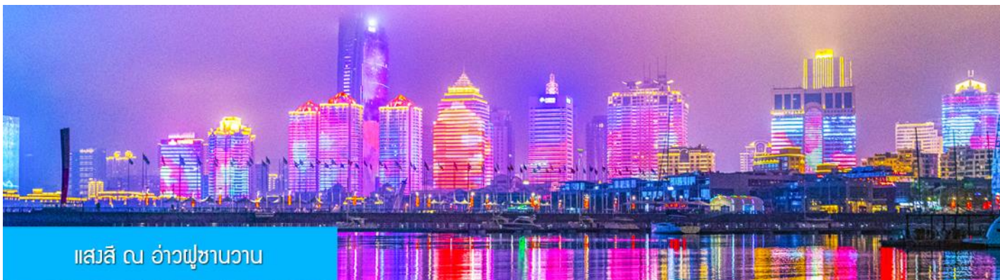
แสงสี ณ อ่าวฝูซานวาน