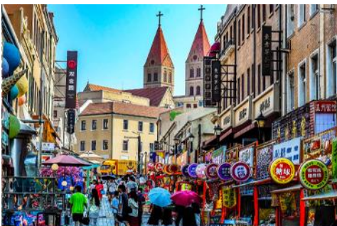
ถนนวาชาน