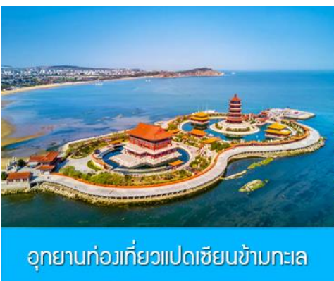
อุทยานท่องเที่ยวแปดเซียนข้ามทะเล