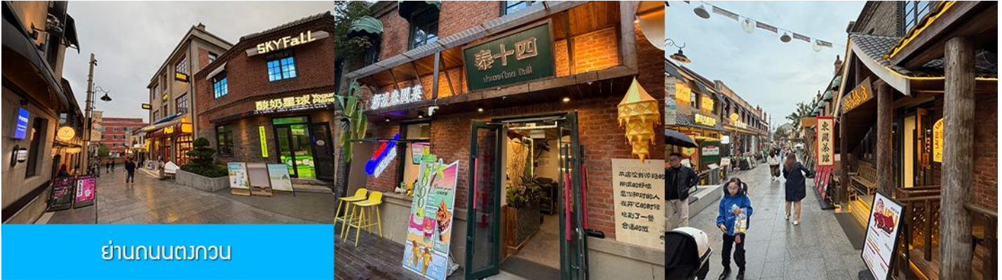
ย่านถนนตวงกวน