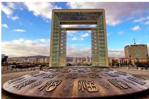
ประตูแห่งโชคกลาง