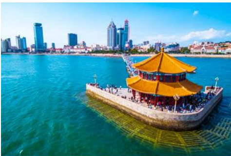
สะพานจ้านเจียว

รับประทานอาหารเช้า ณ ห้องอาหารของโรงแรม (10)