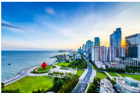
จัตุรัส 4 พฤษภา