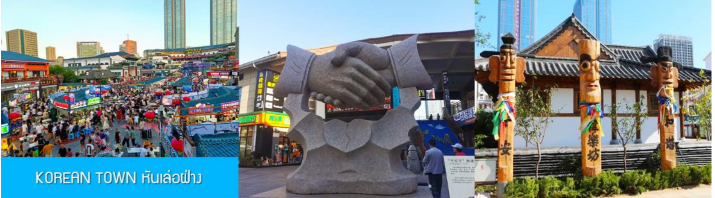
KOREAN TOWN หันเล่อฟาง