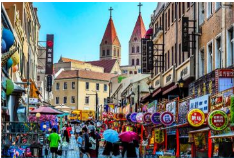
ถนนวงซัน

หลังอาหารนำท่านเดินทางชม สะพานจ้านเฉียว 栈桥 เป็นแลนด์มาร์คแห่งประวัติศาสตร์คู่เมืองชิงเต่า สร้างเมื่อปี ค.ศ.1891 มีลักษณะเป็นสะพานหินทอดยาวกว่า 440 เมตรสู่ทะเล ปลายสะพานมีศาลา ทรงแปดเหลี่ยมสีแดงที่โดดเด่น ซึ่งเป็นสัญลักษณ์บนฉลากเบียร์ชิงเต่า ขึ้นชื่อเรื่องวิวสวย รับลมทะเล ให้ท่านเก็บภาพบรรยากาศ