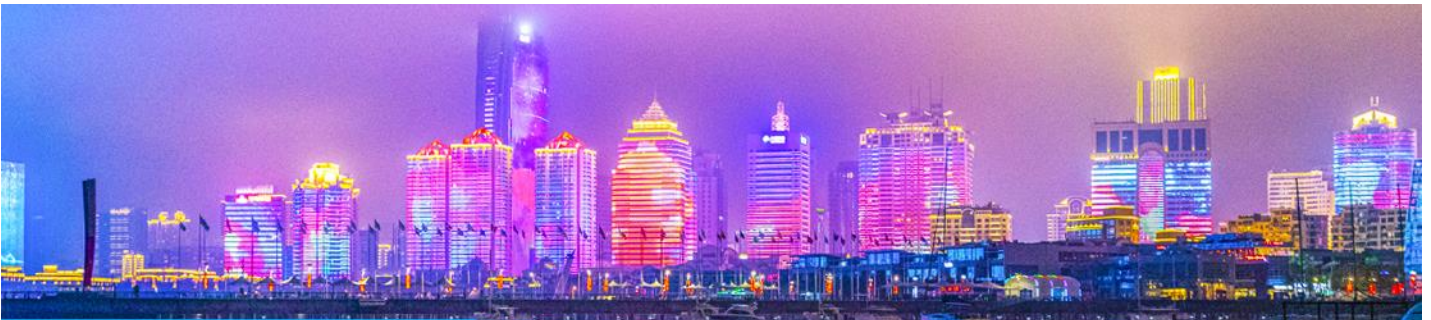
แสงสี ณ อ่าวฟูซานวาน