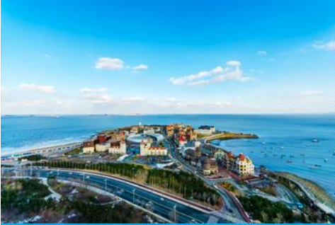
ท่าเรือชาวประมงไห่ซาง