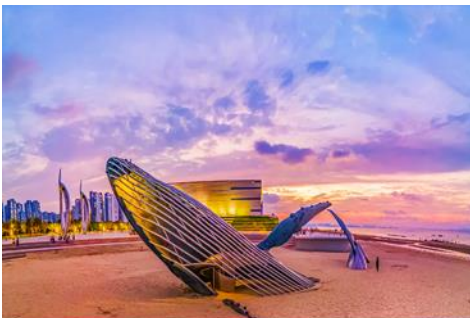
ประติมากรรม วาฬโดดเดี่ยว

จากนั้นนำท่านเดินทางสู่ เมืองเยียนไถ 烟台 (ระยะทาง 72 กม.ใช้เวลาเดินทางราว 1 ชั่วโมง)