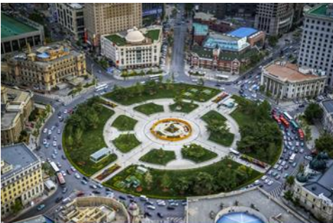
จัตุรัสวงเวียน