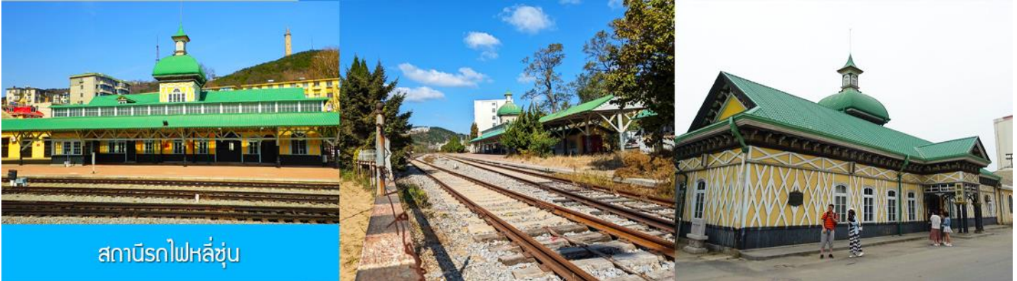
สถานีรถไฟหลี่ซุ่น

นำท่านเที่ยวชมและเก็บภาพ ณ สถานีรถไฟหลี่ซุ่น 旅顺火车站 เป็นสถานีปลายทางของเส้นทางรถไฟสาขา เส้นหยาง - ต้าเหลียน สร้างขึ้นในปีค.ศ. 1903 ออกแบบโดยสถาปนิกชาวรัสเซีย เป็นอาคารอิฐก่อปูนผสม โครงสร้างไม้ตามสถาปัตยกรรมรัสเซีย.