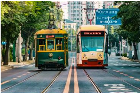
รถรางไฟฟ้า