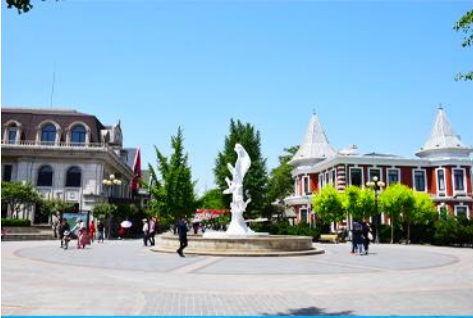
ถนนญี่ปุ่น