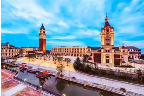
เมืองวนิสตะวันออก