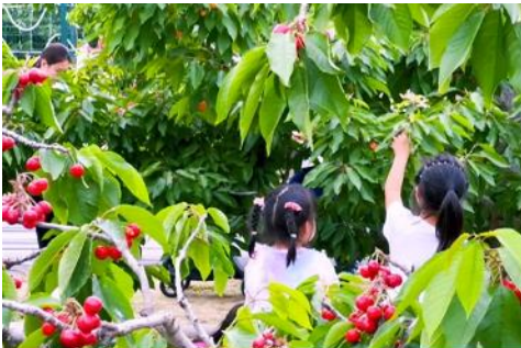
สวนเชอร์รี่

เช้า รับประทานอาหารเช้า ณ ห้องอาหารของโรงแรม (10)