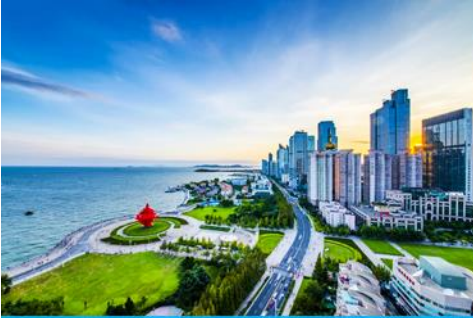
จัตุรัส 4 พฤษภาคม