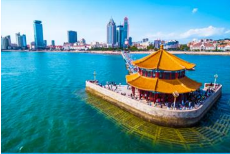
สะพานเคียงเฉียว