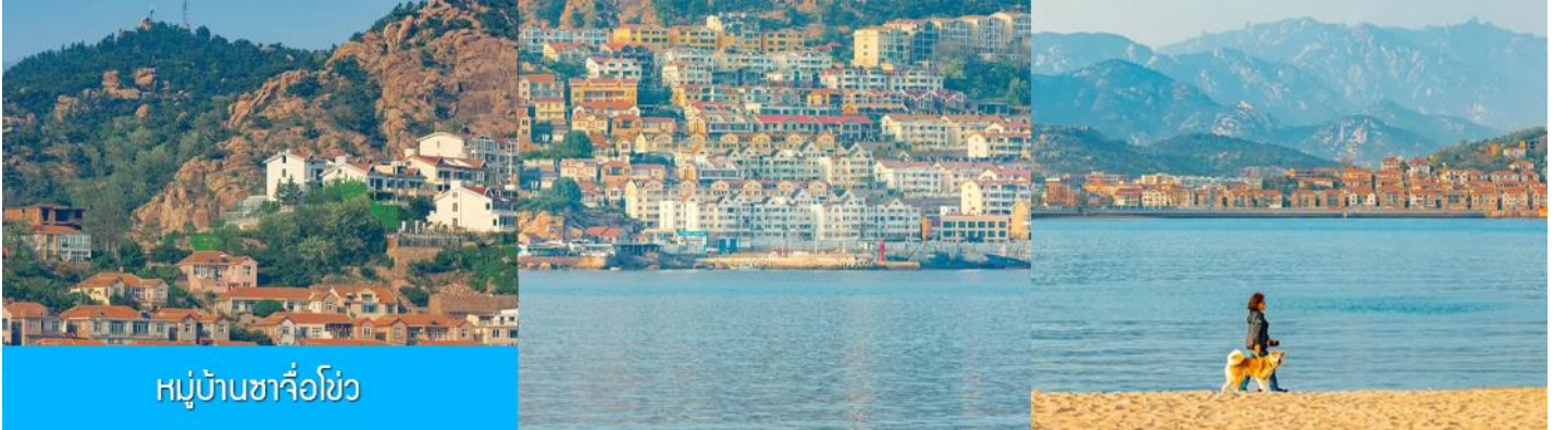
หมู่บ้านชาจื่อโจว