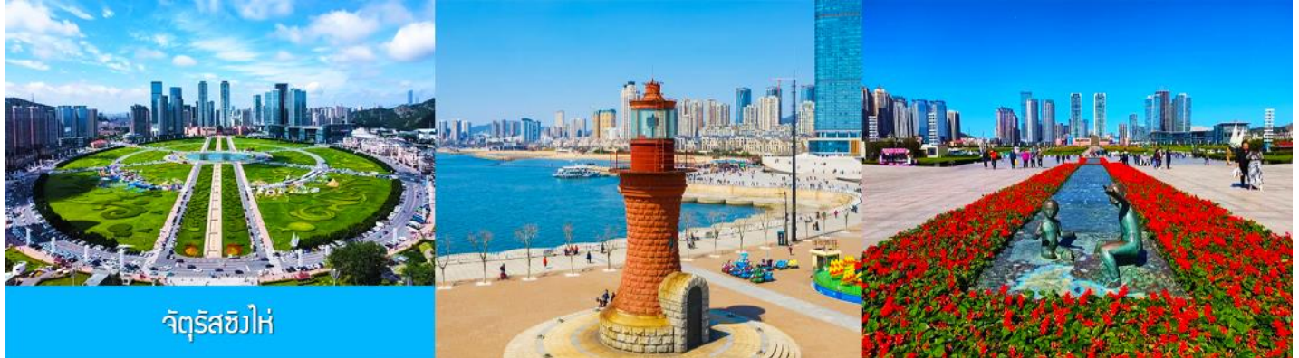
จัตุรัสซีไห่

นำท่านเที่ยวชม จัตุรัสซีไห่ 星海广场 เป็นจัตุรัสขนาดใหญ่เป็นแลนด์มาร์คสำคัญของเมืองต้าเหลียน สร้างขึ้นเพื่อเฉลิมฉลองในโอกาสที่รัฐบาลอังกฤษคืนเกาะฮ่องกงในให้จีนในปี ค.ศ. 1997 ตั้งอยู่ชายฝั่งทะเลในเมืองต้าเหลียน เป็นจัตุรัสใจกลางเมืองที่ใหญ่ที่สุดในโลกและเป็นแลนด์มาร์คของเมืองต้าเหลียน รายล้อมด้วยตึกระฟ้าที่ทันสมัย ภายในมีบ่อน้ำพุดนตรี ลานหญ้าขนาดใหญ่ และลานกว้างสำหรับจัดกิจกรรมกลางแจ้ง อาทิ เทศกาลเบียร์นานาชาติ การแข่งขันวิ่งมาราธอน งานแฟชั่นนานาชาติเมืองต้าเหลียน ฯลฯ